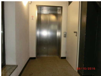
Gang zum Aufzug