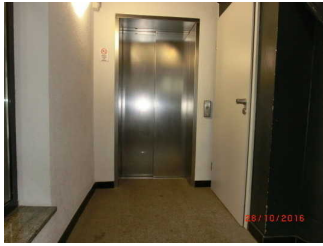
Gang zum Aufzug