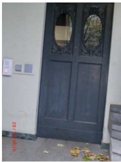
Seiteneingang zum Aufzug

Auf folgende zu nutzende Wege wird hingewiesen: Weg außen