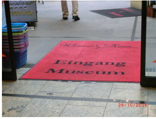
Windfangtür zum Shop

Die Tür gehört zu: Eingang, Seiteneingang für Rollstuhlnutzung