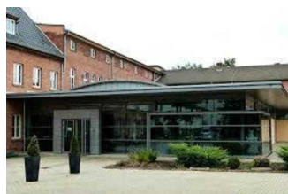
Das Gebäude der Porzellanmanufaktur