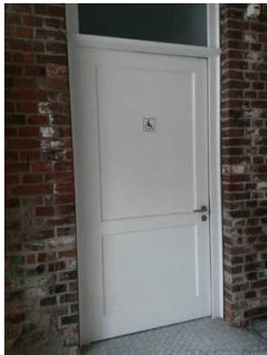
Tür zum WC