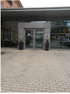
Eingang zum Gebäude