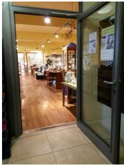
Blick in den Shop mit Kasse