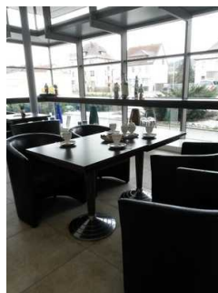
Sitzmöglichkeit und Bistro in der Ausstellungshalle

Auf folgende zu nutzende Wege wird hingewiesen: Rundgang durch die Manufaktur