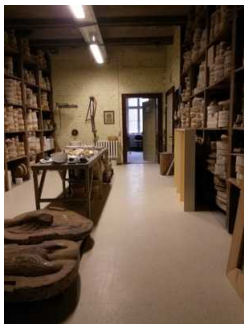
Weg durch die Schaumanufaktur