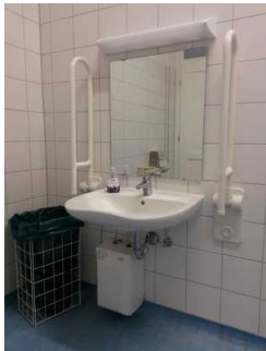
Blick auf das Waschbecken

Die Toilette gehört zu: Ausstellungshalle , Produktionsraum "Brennerei"