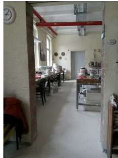
Weg durch die Manufaktur