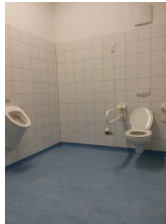
Blick in den Raum