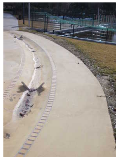
Wasserrinne zum Kinderbecken