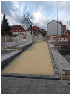
Weg mit Steigung