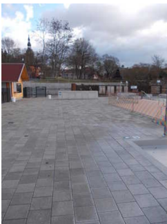
Betonboden am Becken