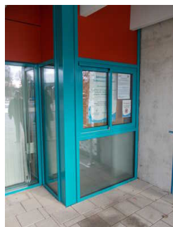
Kasse und Information

Der Schalter/Tresen/die Kasse ist von der Eingangstür aus direkt sichtbar.