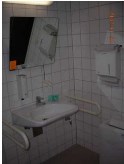
Waschbecken und Spiegel