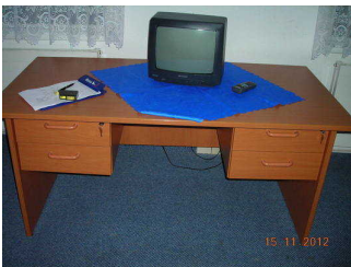
Tisch mit Fernseher