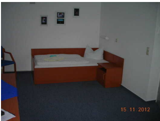
Zimmer, Behinderteneignet rechts