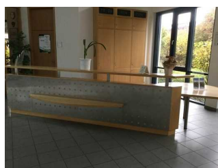
Empfang, Tresen, Kasse