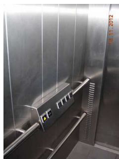
Tastatur im Aufzug mittig und horizontal