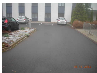
Parkplatz am Eingang

Es ist ein allgemeiner Parkplatz vorhanden.