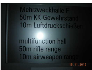
Mehrzweckhalle mit Schießstand, Beschilderung