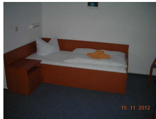
Zimmer linke Seite