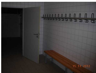
Umkleide / Garderobe für Sportler

Die Umkleidekabine gehört zu: Schießsportanlage, Schießstand