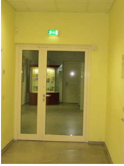
Gang im Untergeschoss zur Zeisswerkstatt

Über den Flur / Weg / Durchgang sind zu erreichen: Zeisswerkstatt im Untergeschoss , Holografie im Untergeschoss , Öffentliches WC