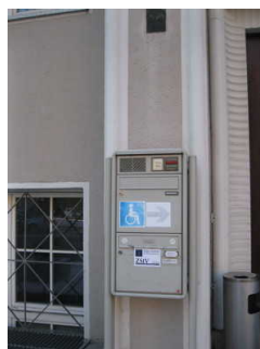
Hinweis zum Seiteneingang für Rollstuhlonutzung

Name und Logo des Betriebes/der Einrichtung sind von außen klar erkennbar.