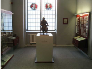
Vitrinen und Sockel mit Büste

Anmerkungen für den Gast: Das Plateau / Ebene mit Mikroskopen ist bei Rollstuhlnutzung nicht erreichbar. Die Ausstellung ist als Rundgang konzipiert.