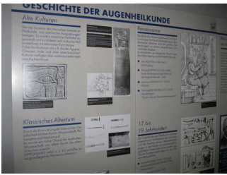
Informationstafel zu Ausstellung

Keine Informationen vorhanden, die der Orientierung dienen und aus Wörtern bestehen.