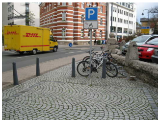
Parkplatz am Volkshaus