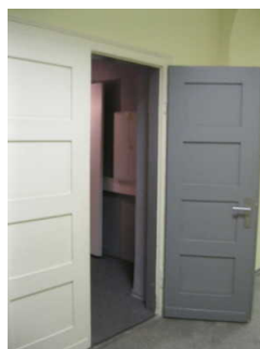
Tür zur Ausstellung