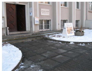
Weg zu Haupteingang

Über den Weg sind zu erreichen: Seiteneingang , Haupteingang