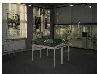
Exponate der Augenheilkunde