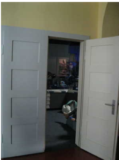
Tür zu Ausstellung Planetariumstechnik

Anmerkungen für den Gast: Der Raum mit Planetariumstechnik und ist nur über die Treppe zugänglich.