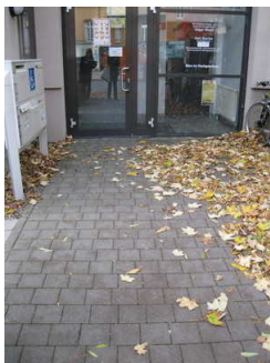
Weg zu barrierefreien Seiteneingang