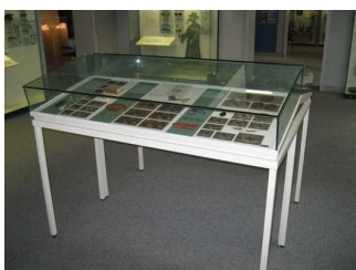
Vitrinen-Tisch mit Exponaten