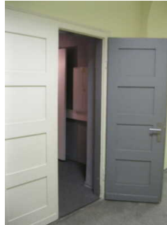
Tür zur Ausstellung

Anmerkungen für den Gast: Die Ausstellung ist als Rundgang konzipiert und nur über Stufen zugänglich.