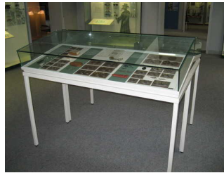
Vitrinen-Tisch mit Exponaten