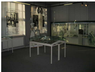
Exponate der Augenheilkunde