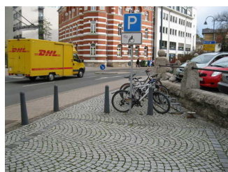
Parkplatz am Volkshaus