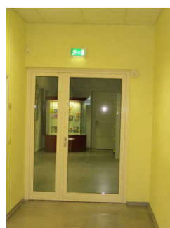
Tür zum Untergeschoss und Zeisswerkstatt