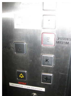
Bedienfelder im Aufzug

Über den Aufzug sind zu erreichen: Seiteneingang , Geschichte Augenheilkunde Erdgeschoss , Ausstellungsraum Mikroskope Erdgeschoss