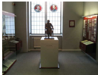
Vitrinen und Sockel mit Büste

Anmerkungen für den Gast: Das Plateau / Ebene mit Mikroskopen ist bei Rollstuhlnutzung nicht erreichbar. Die Ausstellung ist als Rundgang konzipiert.