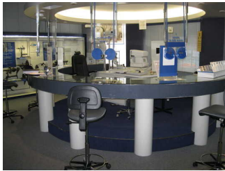
Tisch für Technik der Augenheilkunde