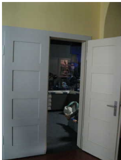
Tür zu Ausstellung Planetariumstechnik

Anmerkungen für den Gast: Der Raum mit Planetariumstechnik und ist nur über die Treppe zugänglich.