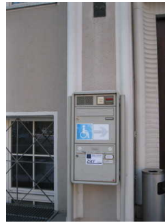
Hinweis zum Seiteneingang für Rollstuhlonutzung

Anmerkungen für den Gast: Am Haupteingang wird auf den Seiteneingang für Rollstuhlnutzung hingewiesen.