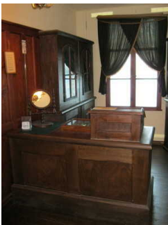
Historische Möbel Zeisswerkstatt