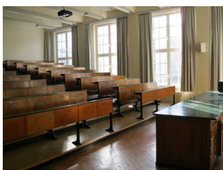
Blick in Hörsaal

Anmerkungen für den Gast: Der Hörsaal ist nur über Stufen zugänglich.