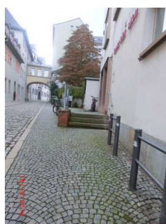
Seiteneingang aus Richtung Markt 10 kommend