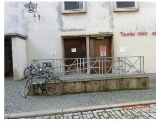
Seiteneingang Kollegiengasse für Rollstuhlnutzung