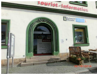
Eingang am Marktplatz