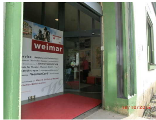
Eingangsbereich mit Matte