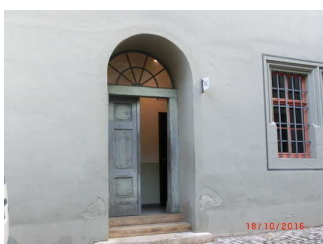
Kollegiengasse öffentliches WC gegenüber vom Seiteneingang der Tourist Information