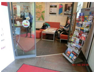
Glas-Eingangstür öffnet automatisch