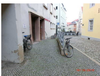
Seiteneingang für Rollstuhlnutzung mit Rampe