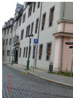
Markt 16, Kollegiengasse