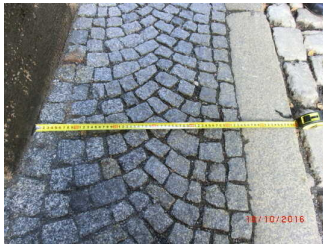
Weg Kollegiengasse vom Parkplatz kommend