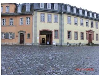
Pflaster auf dem Frauentorplatz und Museumseingang