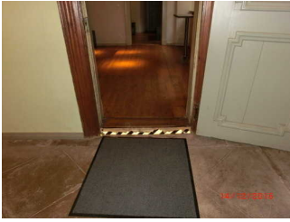
Türdurchgang mit Schwelle und Markierung