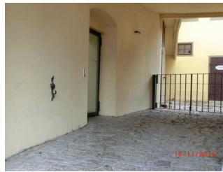
Glastür-Eingang links zur Kasse

Name und Logo des Betriebes/der Einrichtung sind von außen klar erkennbar.