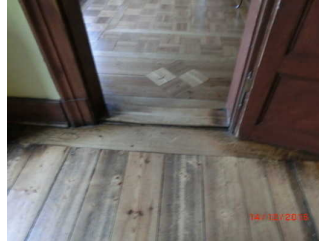
Schwelle am Durchgang zum nächsten Raum

Über den Flur / Weg / Durchgang sind zu erreichen: Eingang Goethe Wohnhaus , Historische Räume im Goethe Wohnhaus