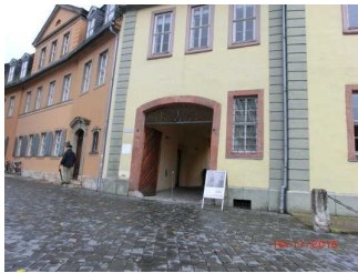
Zentraler Eingang vom Museum