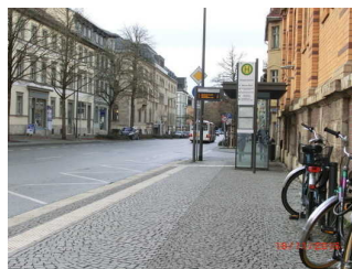
Wielandplatz mit Leitsystem

Entfernung der Haltestelle für Menschen mit Behinderung zum Eingangsbereich: 140 m.