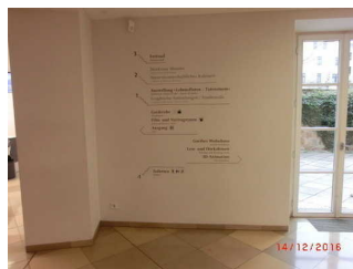
Lageplan im Gothe Nationalmuseum

Der Schalter/Tresen/die Kasse ist von der Eingangstür aus direkt sichtbar. Der Schalter/Tresen/die Kasse ist von der Eingangstür aus nicht direkt sichtbar und der Weg nicht bildhaft und unterbrechungsfrei gekennzeichnet.