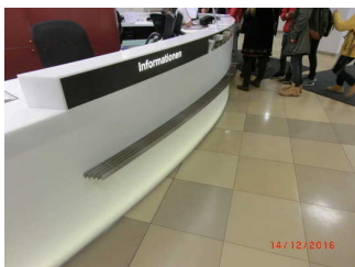
Kasse und Information