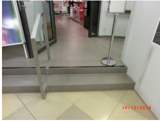
Stufen zum Shop