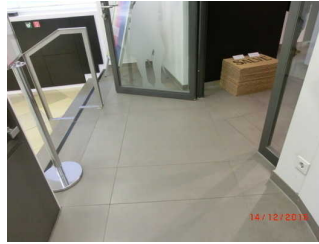
Eingang zum Shop über Rampe

Anmerkungen für den Gast: Der Shop mit Kasse im separaten Raum ist über Stufen oder eine Rampe erreichbar.