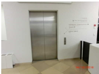
Aufzug zum WC im Goethe Nationalmuseum