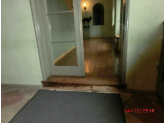
Tür mit Stufe auf dem Rundgang