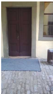
Eingangstür Gothe Wohnhaus

Name und Logo des Betriebes/der Einrichtung sind von außen nicht klar erkennbar.