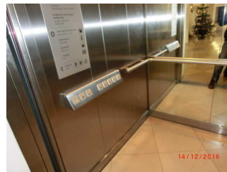
Aufzugskabine und Tastatur

Die Bedienelemente bzw. die Beschilderung sind bildhaft dargestellt.