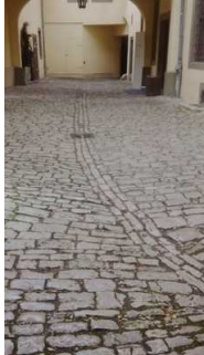
Hof mit Pflaster und Regenrinne

Über den Weg sind zu erreichen: Eingang Goethe Wohnhaus, Film-Vortragsraum Eingang im Hof