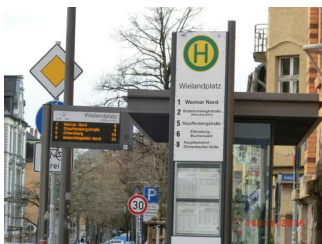
Haltepunkt Wielandplatz mit elektronischer und akustischer Anzeigetafel