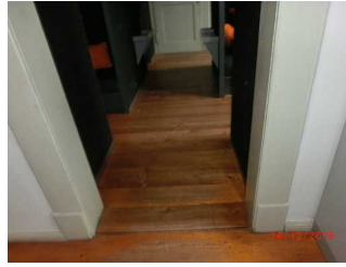
Durchgang zum nächsten Raum im Goethe Wohnhaus