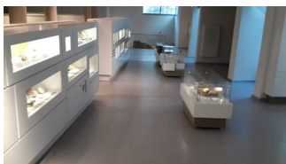
Ausstellungsraum und Beleuchtung der Vitrinen

Informationen zu den Exponaten werden schriftlich vermittelt. Es gibt akustische Informationen zu den Exponaten. Informationen zu den Exponaten sind als fotorealistische Darstellung vorhanden.