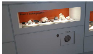
Exponate mit Hörstation