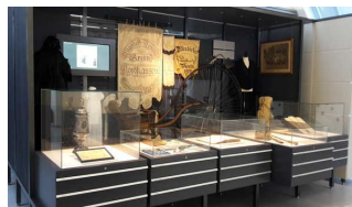
Exponate beleuchtet in Vitrinen