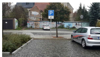
Parkplatz zum Museum

Es ist ein allgemeiner Parkplatz vorhanden.