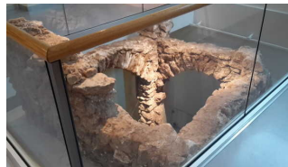
Exponate in Vitrinen