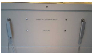
Bedienelemente der Hörstation