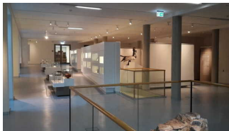
Ausstellungsraum mit Vitrinen