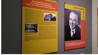
Dokumentation an den Wänden