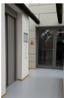
Weg zum Aufzug