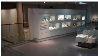
Ausstellungsraum mit Vitrinen