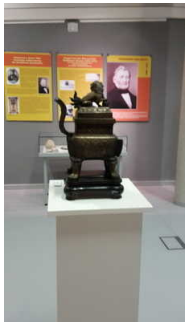
Exponat auf einer Säule

Informationen zu den Exponaten werden schriftlich vermittelt. Informationen zu den Exponaten sind als fotorealistische Darstellung vorhanden.