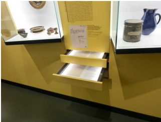
Beschriftungen, Ausstellungstexte und Dokumente in Schubfächern