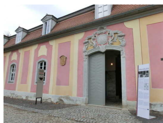
Bauhaus-Werkstatt- Museum Dornburg