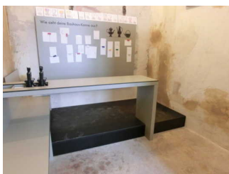
Informationen auf Magnettafel

Anmerkungen für den Gast: Alle Besucher_Innen können sich kostenfrei ihre eigenen Postkarten im Stempeldruckverfahren herstellen, mit Motiven aus der Bauhaus-Töpferei