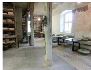
Ausstellungsraum mit Arbeitsplätzen an Töpferscheiben