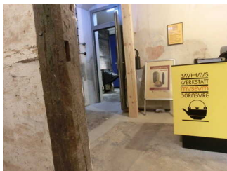
Foyer mit Kasse