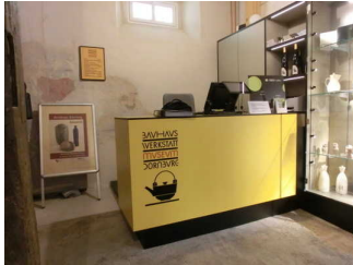
Kasse, Information und Shop

Das Kassendisplay/die Preisangabe an der Kasse ist gut erkennbar (z.B. groß oder schwenkbar).