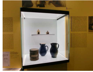
Vitrinen beleuchtet und unterfahrbar