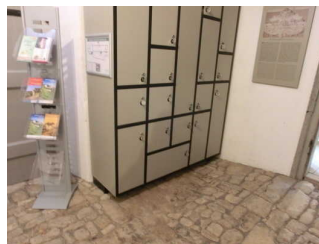
Schließfächer im Foyer

Sanitärraum vorhanden: Öffentliches WC im Museum