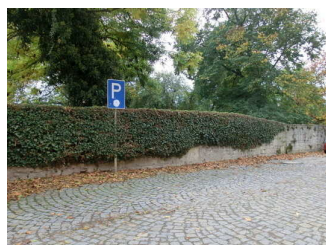
Parkplatz am Eingang

Es ist ein allgemeiner Parkplatz vorhanden.