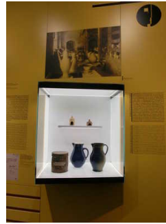
Texte zur Historie und Beschriftungen