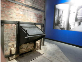
Befuerungsschacht des original Muffelofens von 1937