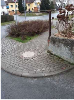
Weg vom Parkplatz zum Hoftor