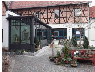
Foyer-Anbau im Hof

Anmerkungen für den Gast: Im Foyer befindet sich das Frühstücksbuffet mit Selbstbedienung. Die Höhe des Buffet-Tisches liegt bei 70 - 95 cm.