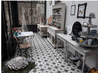
Foyer mit Buffetbereich