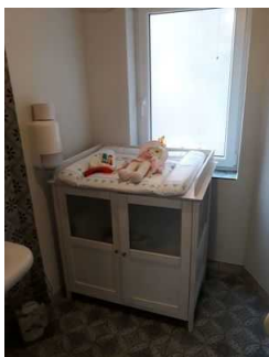
Wickeltisch im Behinderten WC