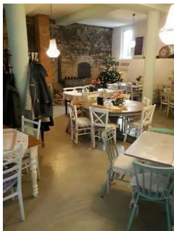
Runde Tische im Café der Patisserie

Es gibt Tische mit heller und blendfreier Beleuchtung.