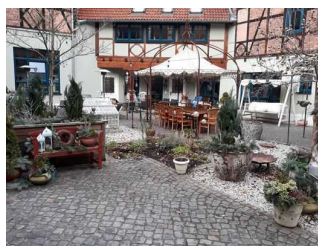
Das Hof-Café der Pâtisserie Bergmann