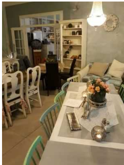
Restaurant und Café der Patisserie