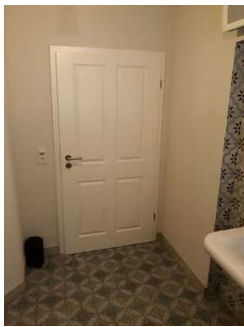
Tür zum Behinderten WC