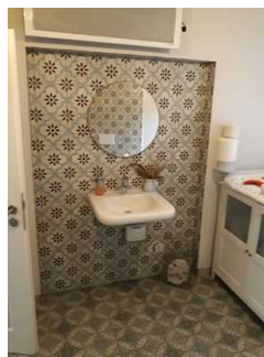
Waschtisch im Behinderten WC

Die Toilette gehört zu: Das Hof-Café der Patisserie Bergmann , Restaurant und Café Patisserie Bergmann , Tortenvitrinen und Buffet , Foyer und Buffet