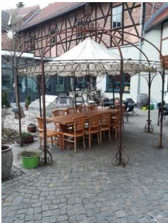
Sitzen und genießen im Hof- Café mit mobiler Bestuhlung