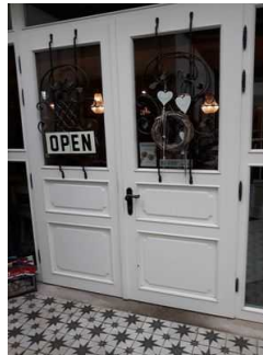
Eingangstür zum Restaurant und Café