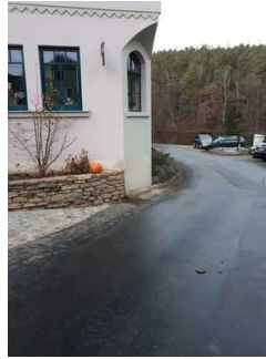
Weg vom Hauptparkplatz

Es ist ein allgemeiner Parkplatz vorhanden.