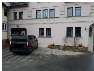
Parkplatz am Eingang

Es ist ein allgemeiner Parkplatz vorhanden.