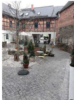
Hof der Patisserie Bergmann