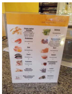
Informationen im Restaurant